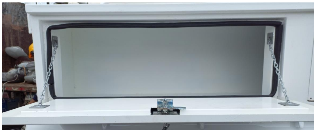
Figura. 4 configuración de la gaveta, con fijación tipo