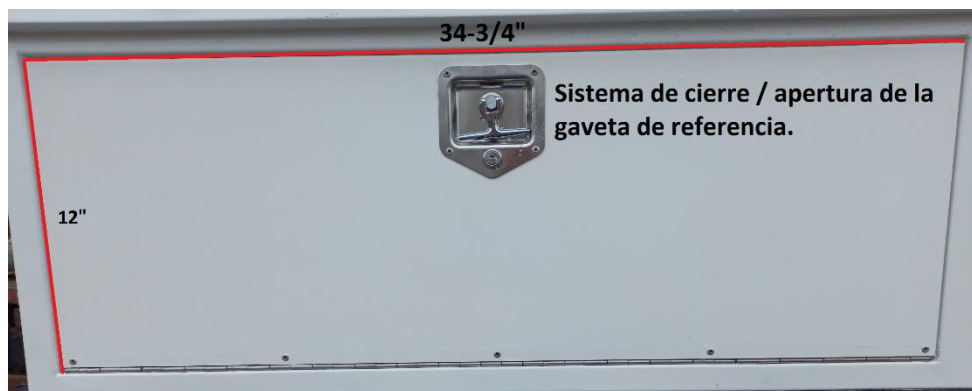
Figura. 2 Medidas internas que puede tener las gavetas del equipo.