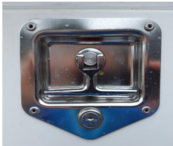
Figura. 6 mecanismo que soporta la tapa de la gaveta con la estructura.

Las puertas de las gavetas deberán ser diseñadas para no permitir la entrada de agua en el interior por lo que las mismas deben tener sellos o un sistema que no permita el ingreso de