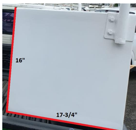
Figura. 3 Medidas externas que pueden tener las gavetas del equipo.