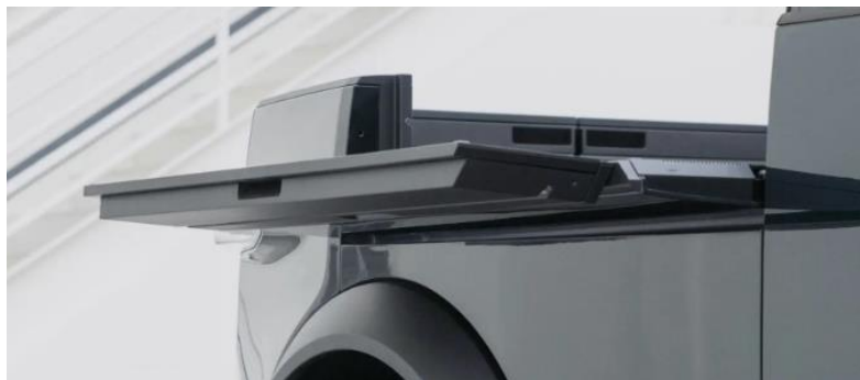
Figura 1. Mesa integrada al vehículo de referencia.