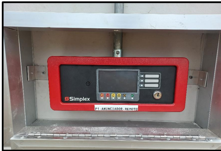
Imagen 3. Anunciador con caja metálica abierta

Para la instalación de los dispositivos, se deberá utilizar el siguiente Cable para alarma de incendio, FPLR, color rojo, AWG18, para el lazo de anunciación . Para las sirenas con luces estroboscópicas se debe utilizar cable para alarma de incendio, FPLR, color rojo, AWG16 . Los conectores y uniones que se utilicen deben ser acordes al tipo y tamaño de tubería solicitada. Las cajas de paso deben tener un tamaño acorde a la cantidad de cables que se designen pasar por la misma. Y las cajas para dispositivos deben ser acorde al tamaño de equipo a instalar.