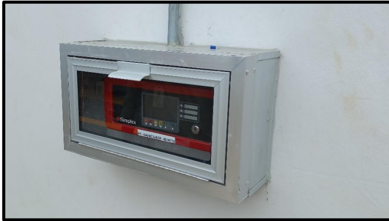
Imagen 2. Anunciador con caja metálica externa